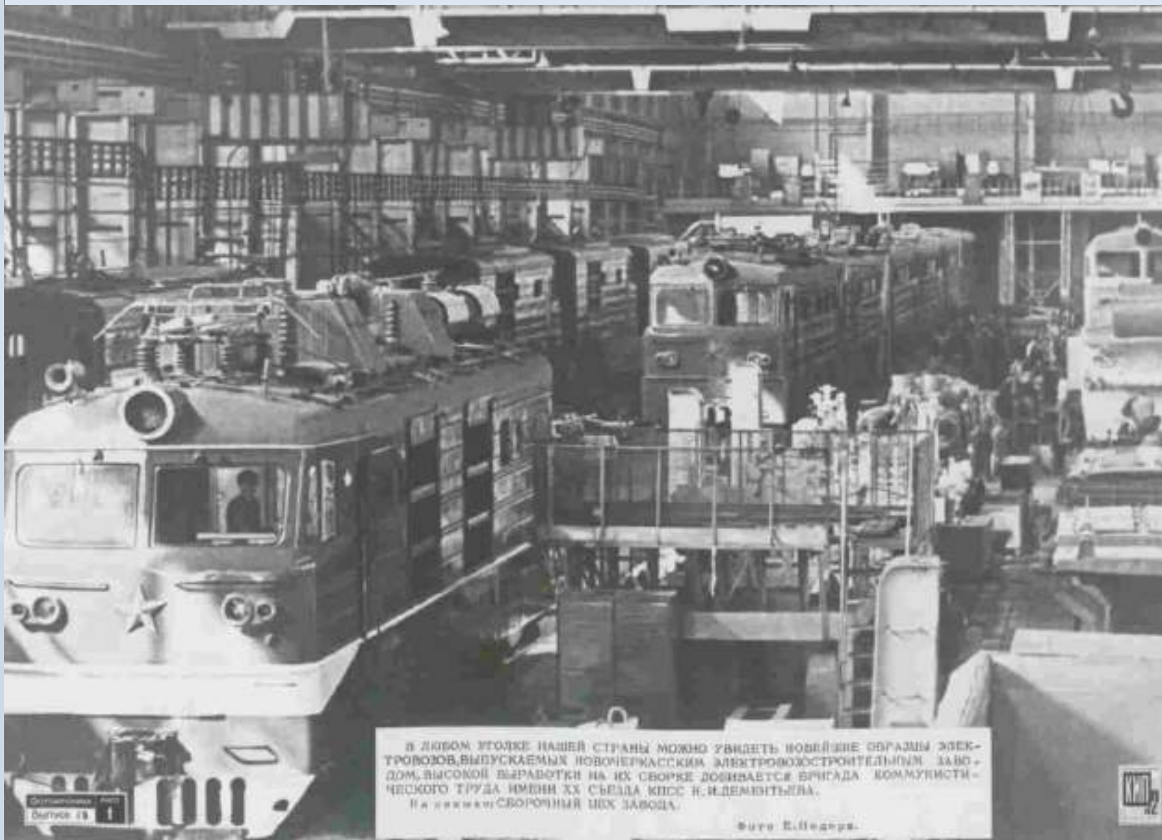
Сборочный цех Новочеркасского электровозостроительного завода (1970). ЦДНРО. Ф.Р-3619. Оп.6. Д.818