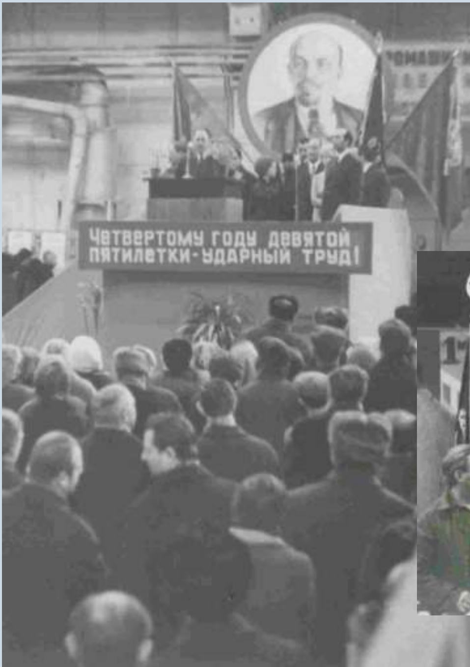
Торжественное собрание, посвященное награждению Новочеркасского электровозостроительного завода орденом Ленина (1971)