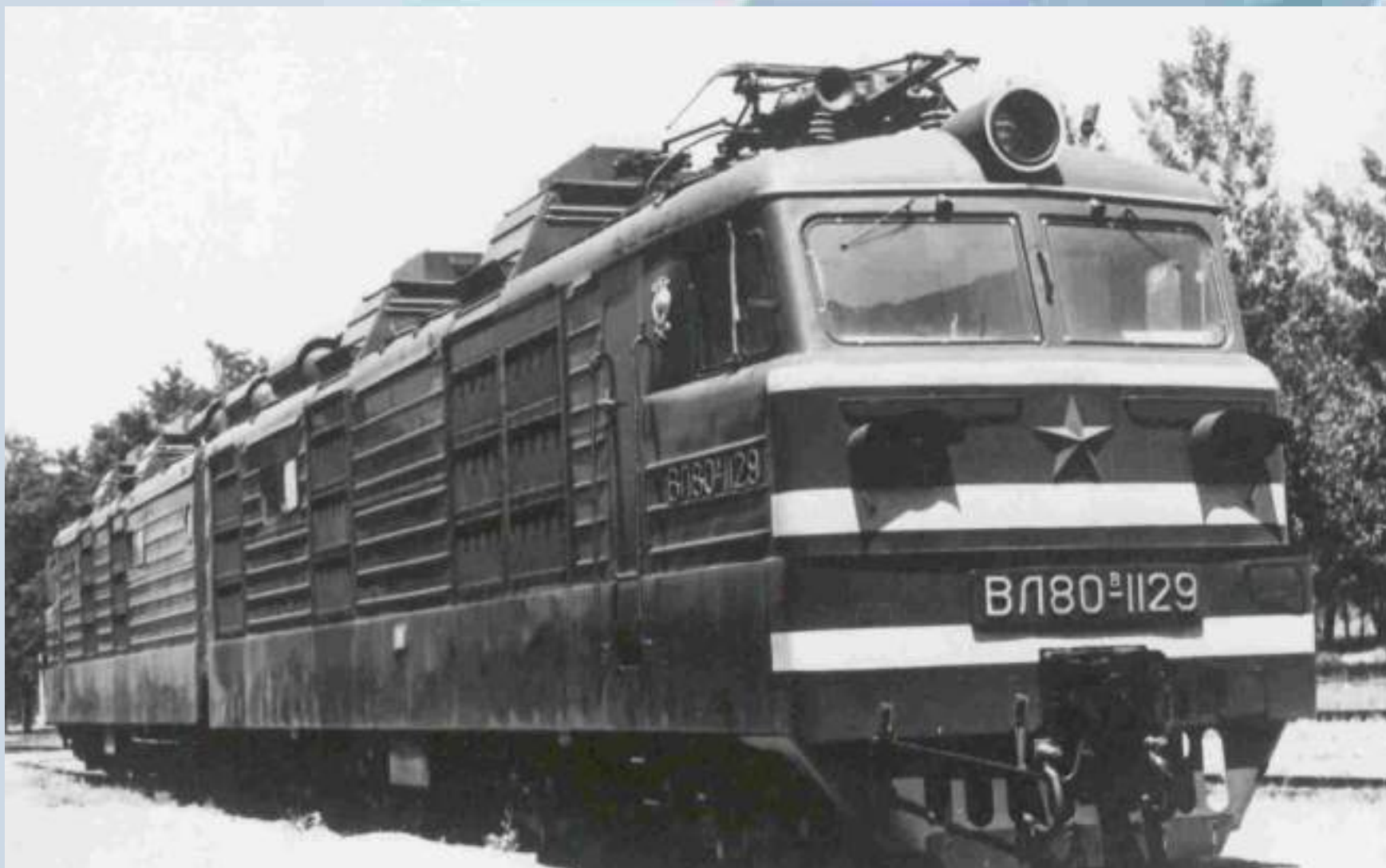
Электровоз серии ВЛ80 В (Владимир Ленин, тип 80), построенный в 1975 году.