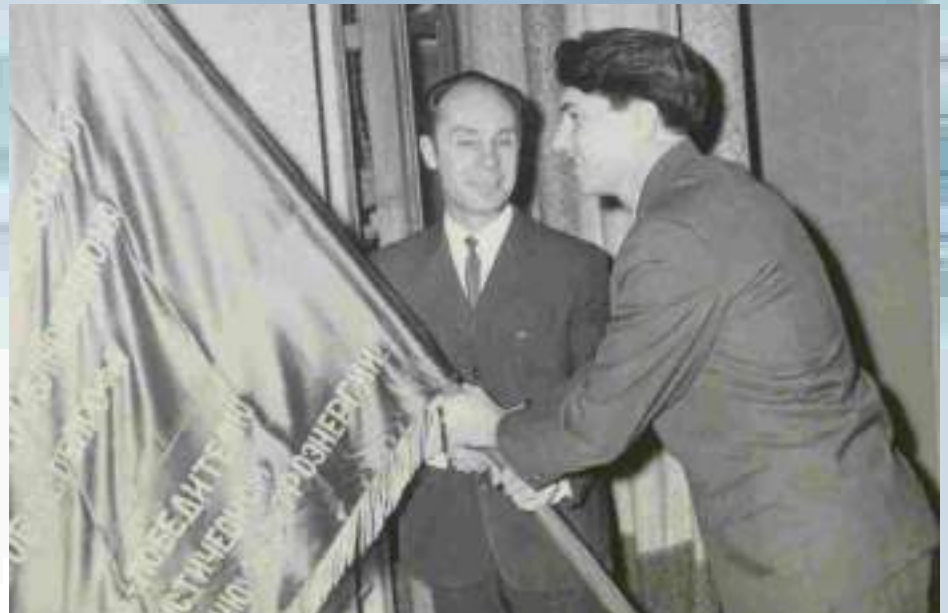
Вручение заводу Переходящего Красного знамени (1974).