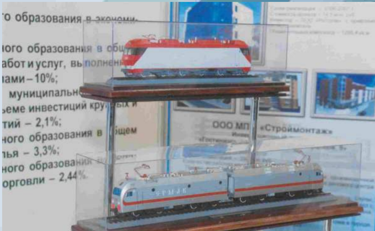
Макеты электровозов, выпущенных Новочеркасским электровозостроительным заводом. Вверху: пассажирский двухсистемный шестиосный электровоз ЭП10. Внизу: грузовой электровоз переменного тока 2ЭС5К «Ермак»