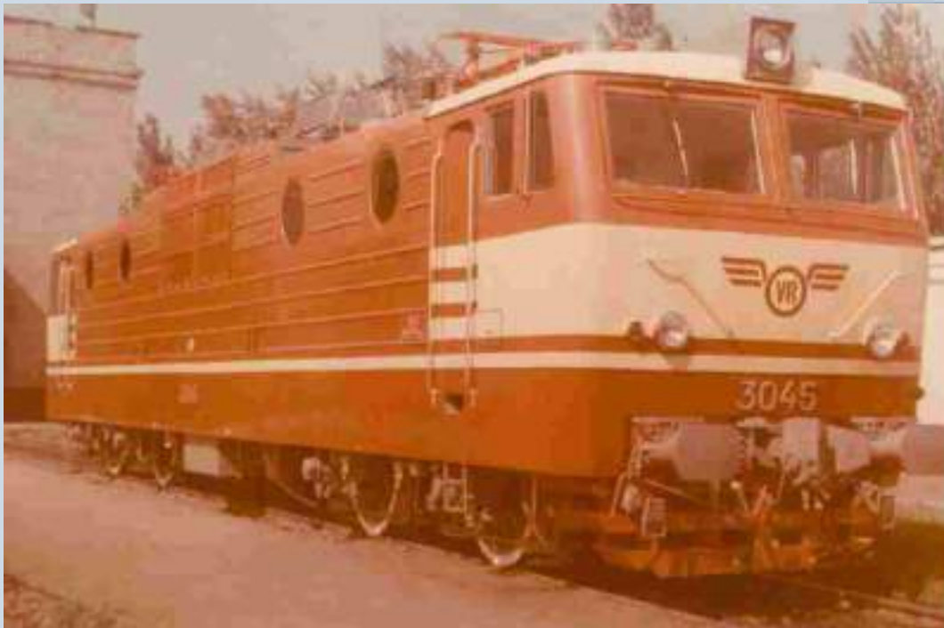
Электровоз, выпущенный заводом для Финляндии (1976).