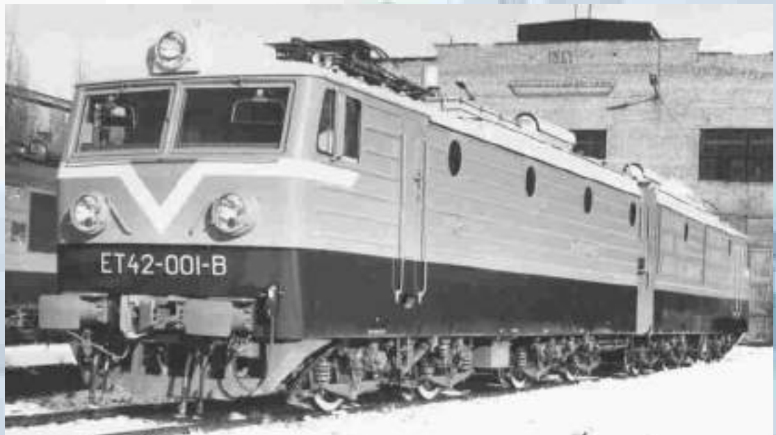
Электровоз для Польской Народной Республики, построенный на НЭВЗ (1979). ЦДНИРО. Ф.Р-3619. Оп.7. Д.2752