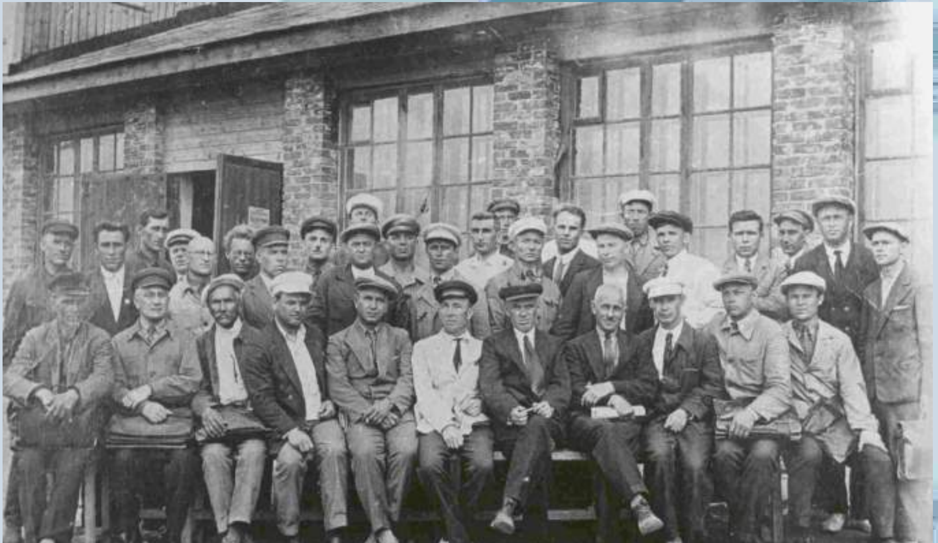
Строители Новочеркасского паровозостроительного завода (НПЗ) (1935). ЦДНИРО. Ф.Р-3619. Оп.3. Д.81