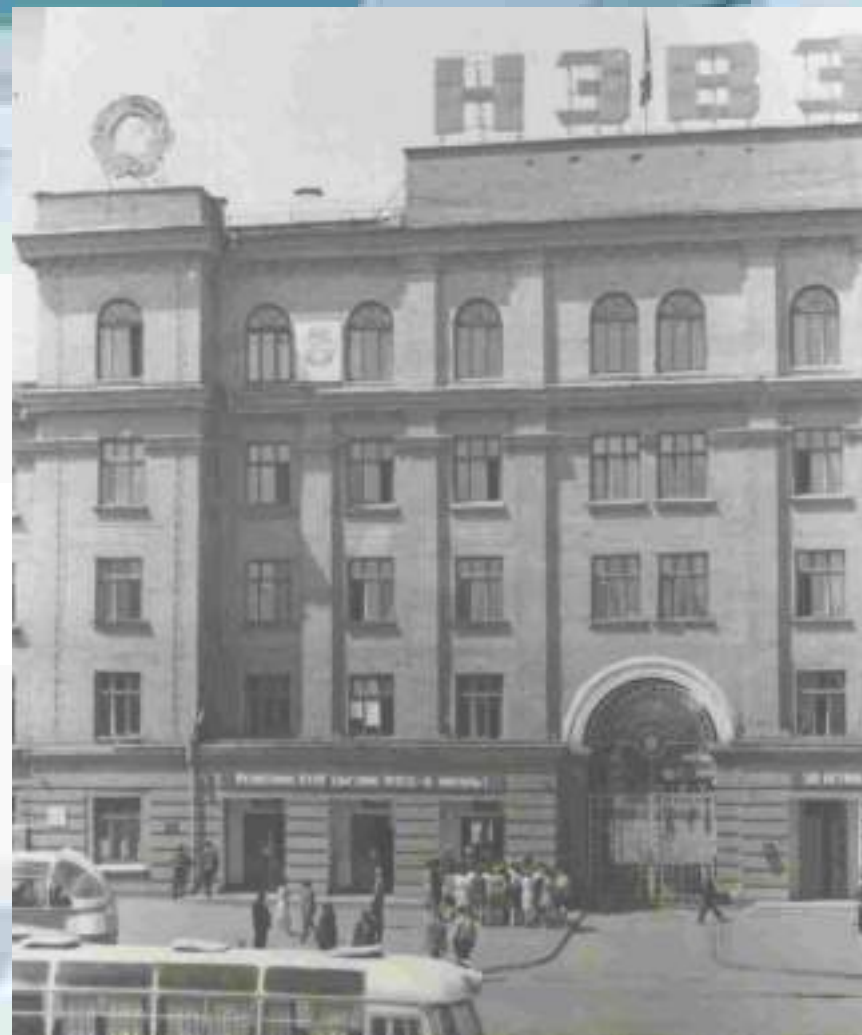
Главная проходная НЭВЗ (1976).