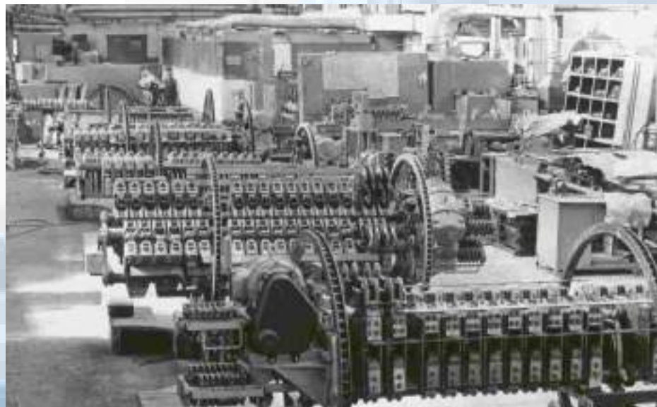
Корпус аппаратного цеха (1976). ЦДНИРО. Ф.Р-3619. Оп.7. Д.1190